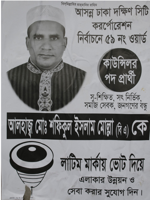
Symbol: en snurretop