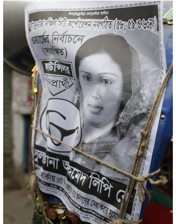
Symbol: et par briller