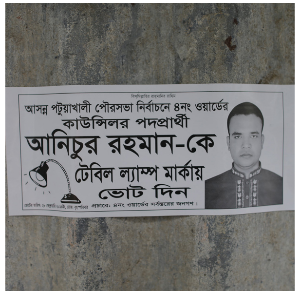
Symbol: en lampe