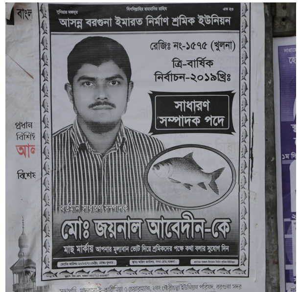
Symbol: en fisk