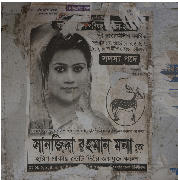
Symbol: et rådyr