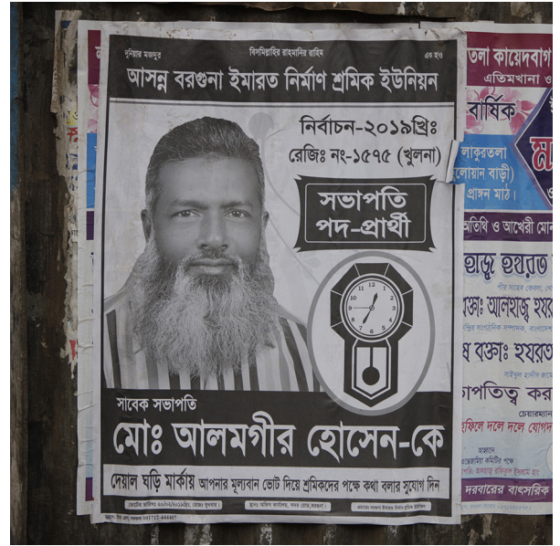
Symbol: et ur