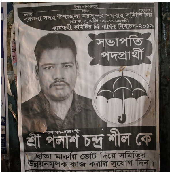
Symbol: en paraply